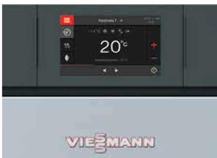
Vitotronic 200: ingebouwde regeling voor verwarmingsketelunits